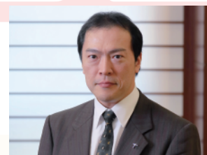
学校法人帝京大学 理事长・校长 冲永 佳史